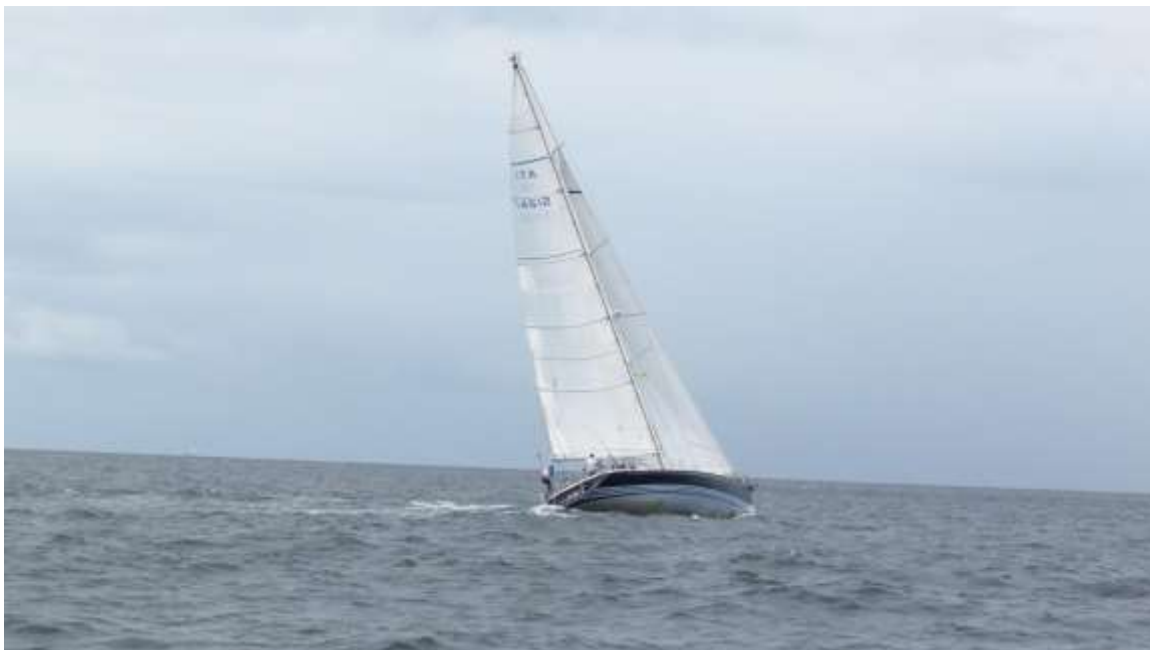
Měli jsme podobnou loď