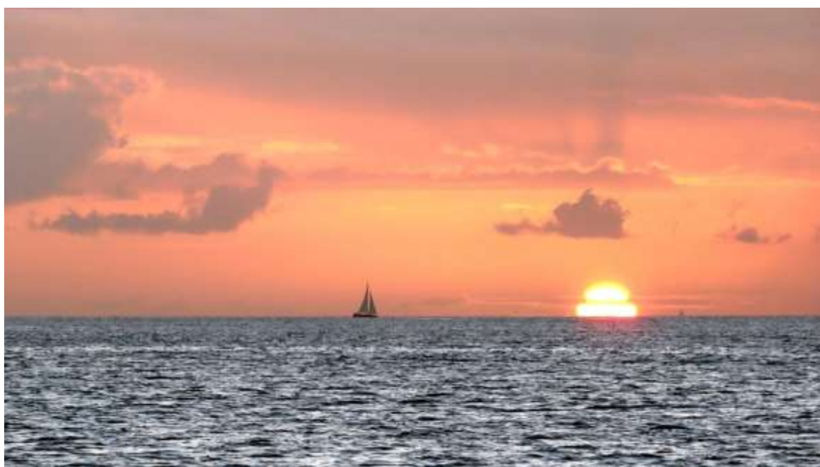
Zažili jsme takové západy slunce