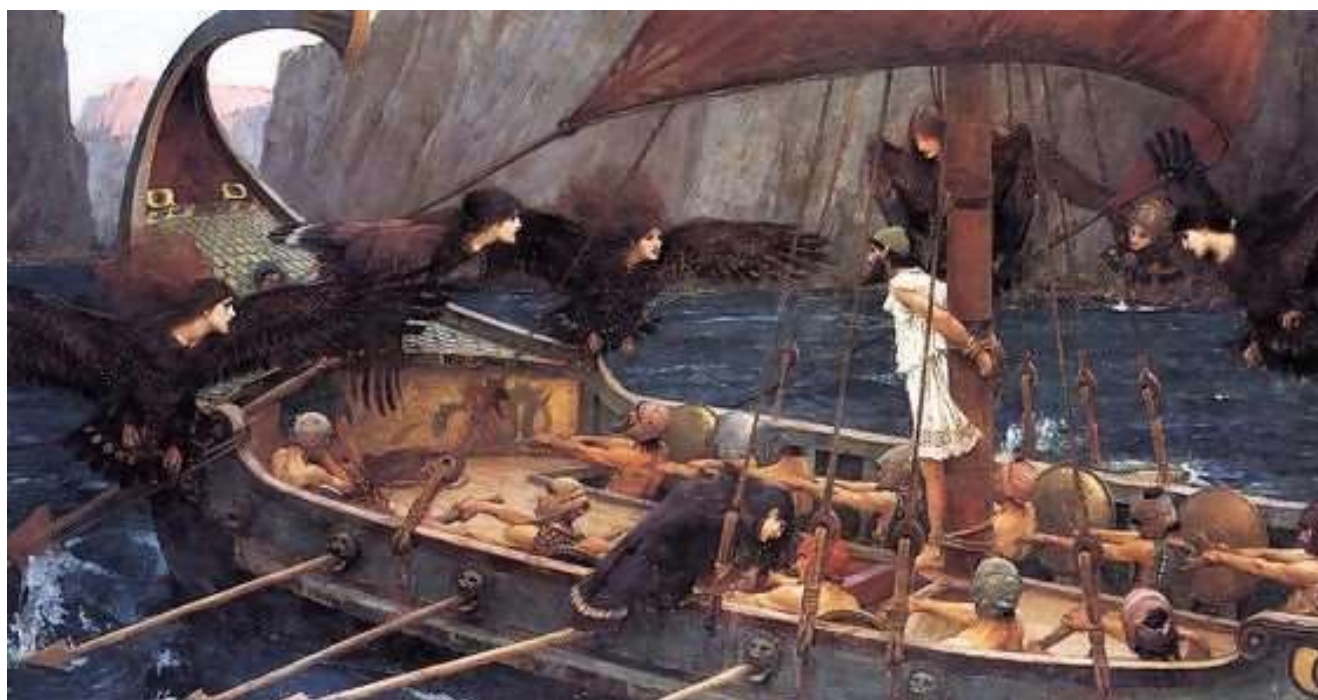
John William Waterhouse (1849 - 1917): „Odysseus a Sirény“ (1891)