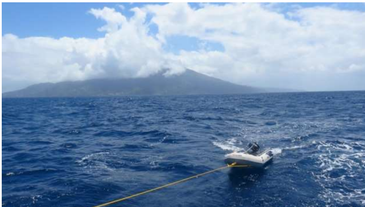
St. Vincent (asi 60 km od St.Lucia)