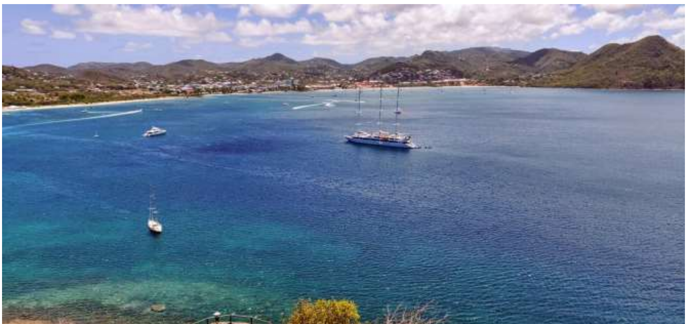
Rodney Bay Saint Lucia